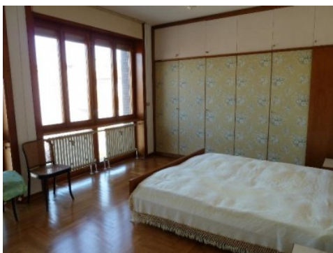
camera da letto