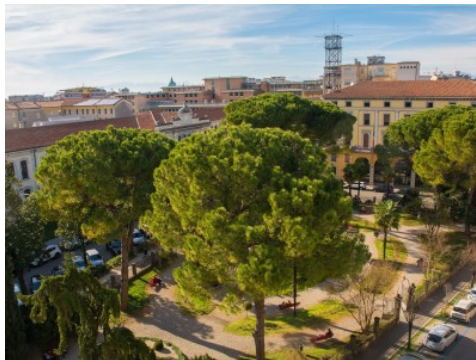
vista dalla terrazza