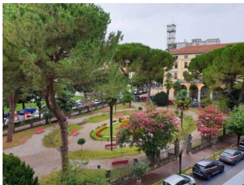
vista dalla terrazza