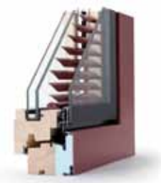
Particolare serramenti spazi residenziali

Finiture di pregio per serramenti e infissi, elevati standard qualitativi per le pavimentazioni, con piastrellati e parquet personalizzabili, pietra naturale per pianie e soglie di finestre e porte, marmo e granito lucidato per le scale.