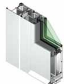
Particolare serramenti spazi commerciali e direzionali